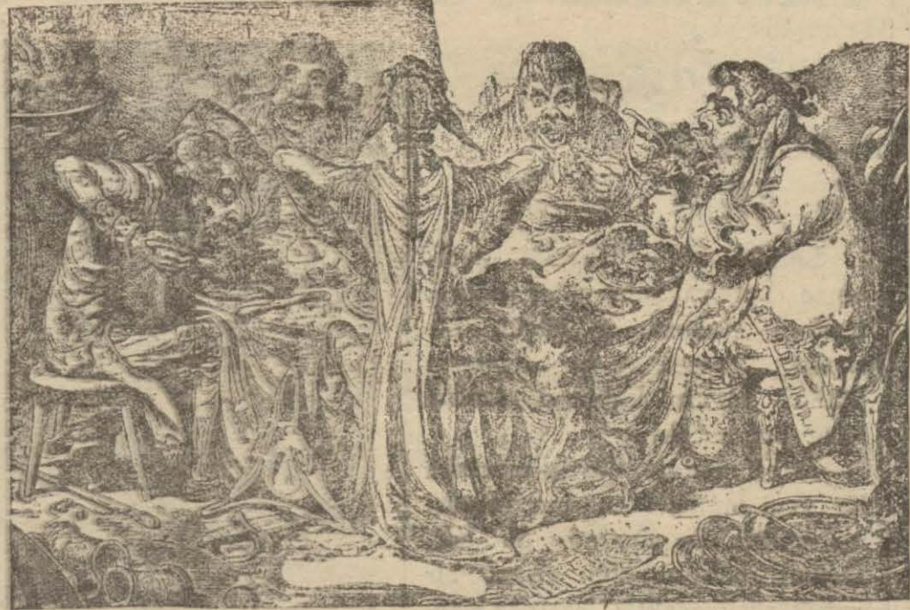
Yüz girmi beş sene evvel böyle acıip iştihâ ile fazla yemek yerlerdi

Ciğerlerin ikinci bir vazifesi de kanı temizlemektir. Eğer kan sıhhi, iyi bir şekilde değilse buna yegâne sebep yediğimiz gıdaların çok veya