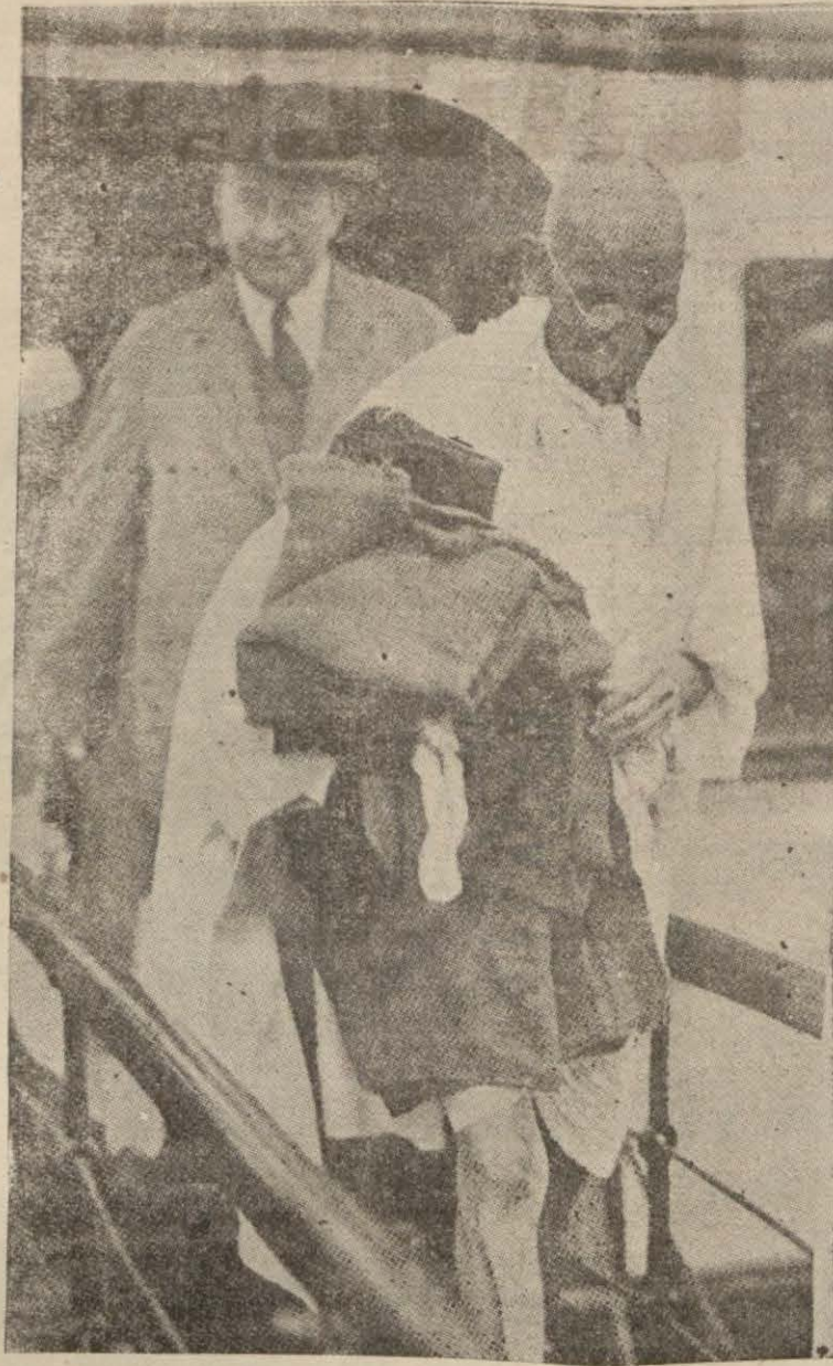
Gandi birkaç ay evvel İngiliz toprağına ayak basarken

— Ya ölmezsek, ya hastalanıp ta kalırsak, dedik ve intihardan vazgeçtik ve öğrendik ki insanın kendi kendisini öldürmesi kolay değildir. O zamandanberi bana her kim intihar edeceğini söylese söyleyin ehemmiyet vermem.