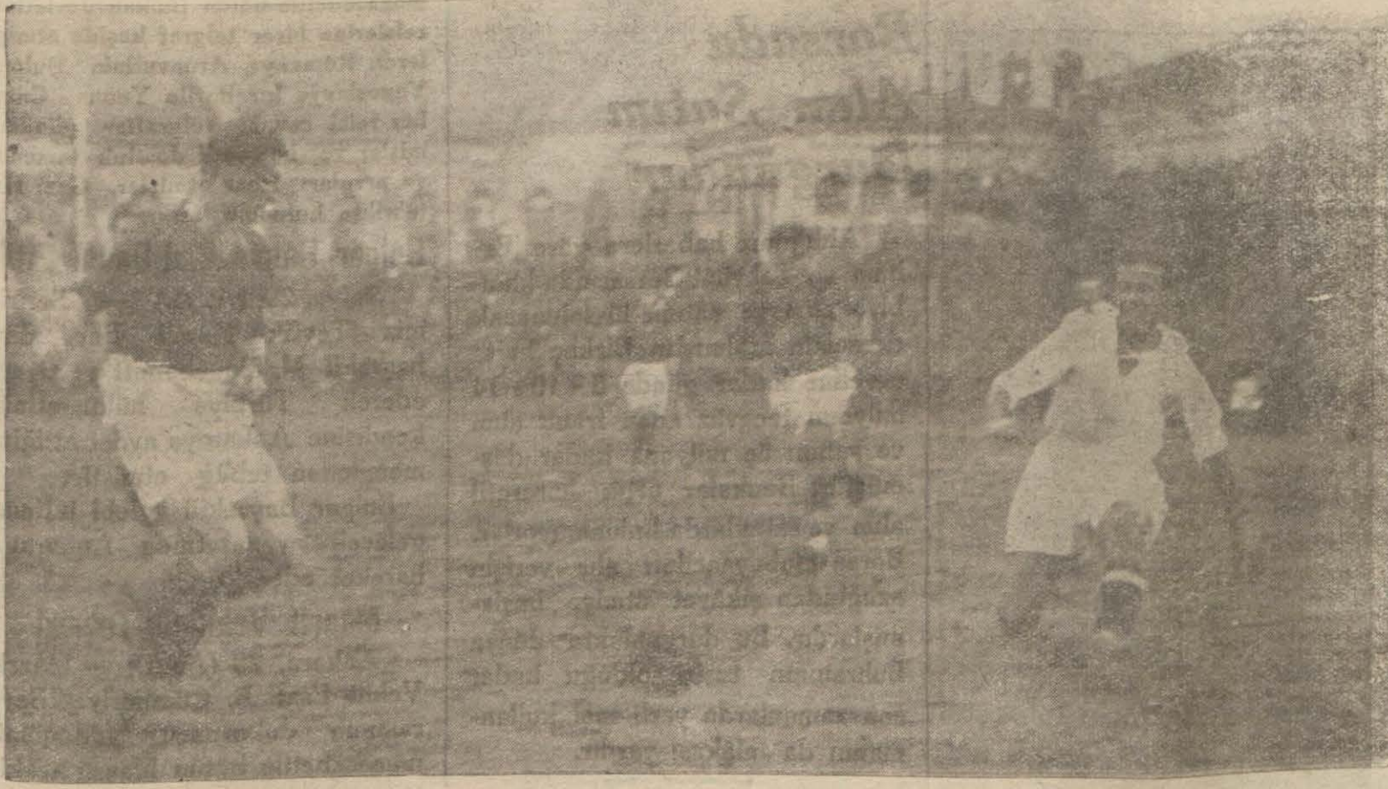
Dünkü maçta Fikretin, hasımlarını geçerek topla beraber kaleye doğru inişini gösteren bir enstantane