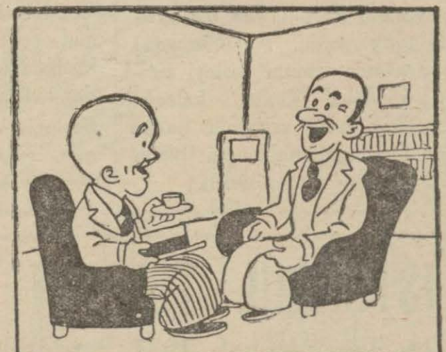
4 : Hasan B. — "Gökte ararken yerde buldum," derler; sen kızını yerde ararken, gökte buldun ha?..