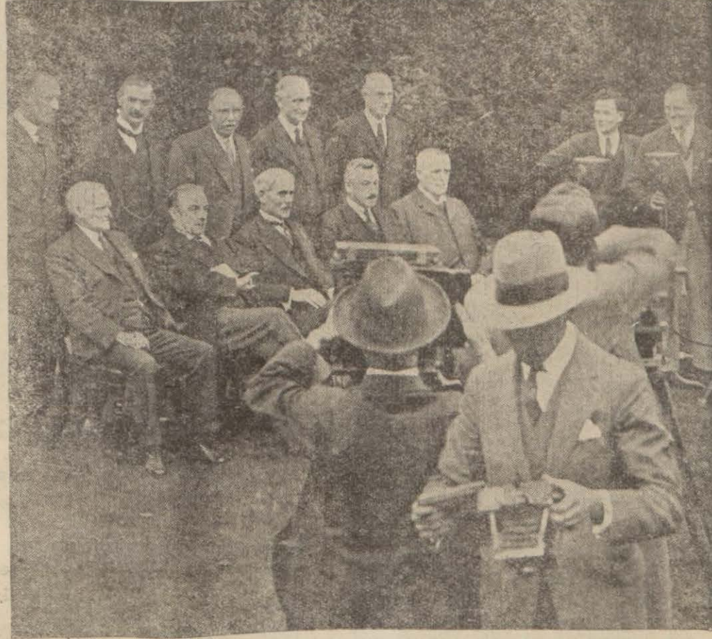
Millî İngiliz hükümetinin intihaptan bir hafta evvel alınmış bir resmi

İngiliz intihabatının son neticelerinden çıkan mana, İngiliz milletinin gümrük meselesi hakkında muhafazakârlar ve millî hükümetle beraber olduğunu gösterdi. Yeni mecliste azim bir ekseriyet kazanan hükümet için şimdi yapılacak şey, devlet makinesinin aksaklık gösteren taraflarını tamir, aksayan itibarını iade ve iktisadi sahada diğer milletlerle rekabet edebilecek bir vaziyet hazırlamaktır.