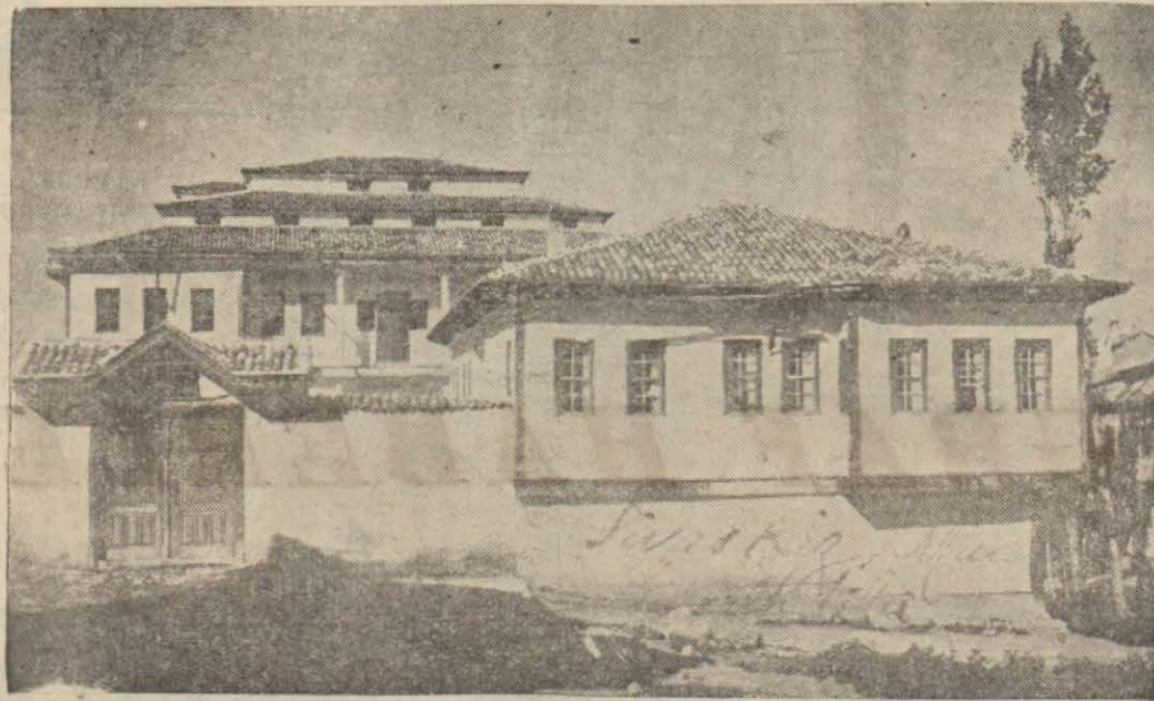
Sıvasta Kız Muallim mektebi binası

Bu vaziyet karşısında burada hiç vakit kaybetmeden bir orta-