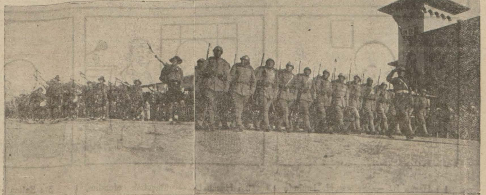
Ankarada Cümhuriyet bayramı intihaları: Meclis önünden askerlerimiz ve izciler geçiyor..

Gerek gazetenizi ve gerek karilerinizi meraktan kurtarmak (Devamı 6 ıncı sayfada)