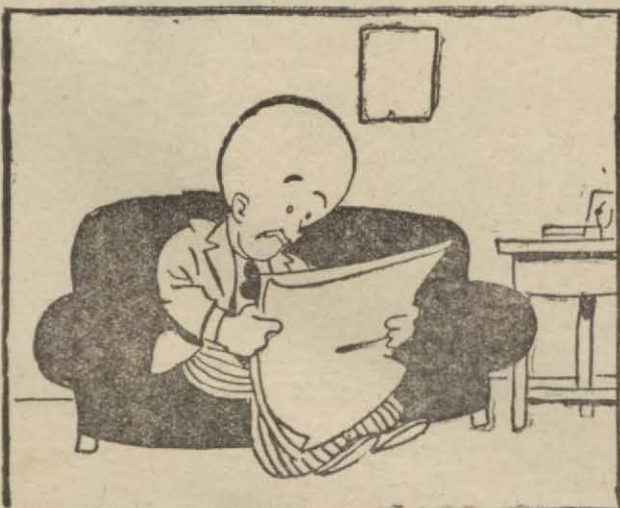
1 : Hasan B. — Selma H. isminde bir Türk kıızı "Hollivut," ta yıldız olmuş. Gidip şunun babasını göreyim.