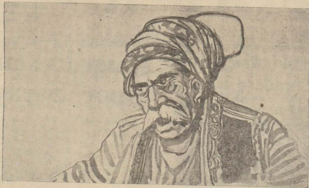
Çelebi zade Şöyle bir düşündü

Besur hovardalar, baygın kadının hüviyetini bilmedikleri için ne yapacaklarını kararlaştıramıyorlardı. Eğer o, ırzehli bir mahlûk ise - velevki ayılmak için olsun - kendisine el deydirmek günahı. Çünkü babayığittlik yasasının hükmü sarih idi: Temiz kadına el vurulmaz!.. Hovardalar işte bu hükme inkiyat ederek önlendeki baygın kadının yüzü-