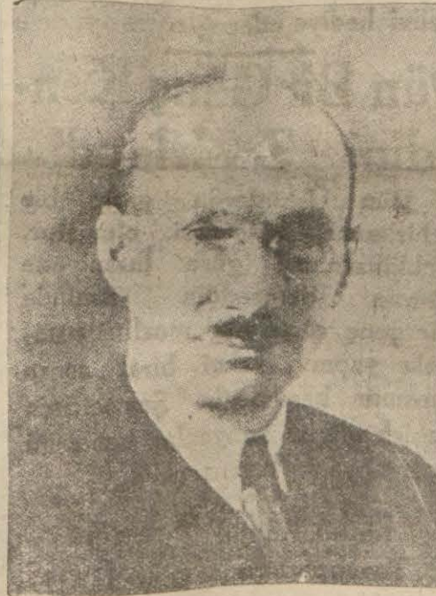
Darülfünunun islahatına memur edilmesi istenenlerden

Meselâ (Bern) Darülfünunun rektörü, kendilerinden bir kısmına hocalık etmiştir. Avrupada mütehasıs kalmamış mıdır ki beşinci derecede bir darülfünun rektörü mütehasıs olarak getiriliyor? Biz bu şekilde bir