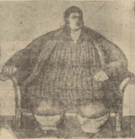
Çok yemek yemekten bu hale gelen İngilterenin şişmanlık şampiyonu "Daniel Lambert,"

fena olmasıdır. Bunun için eğer gıdamıza dikkat etmez, midemizi fazla şişirecek olursak ciğerlerimizi o nisbette yormuş olacağız. İnsan vücudunda mahdut bir derecede kan vardır. Eğer fazla ve fena gıdalar yiyecek olursak.. bu miktar kan bu gıdaları ciğerlerimize kadar taşımakta büyük müşkülât çekecektir.