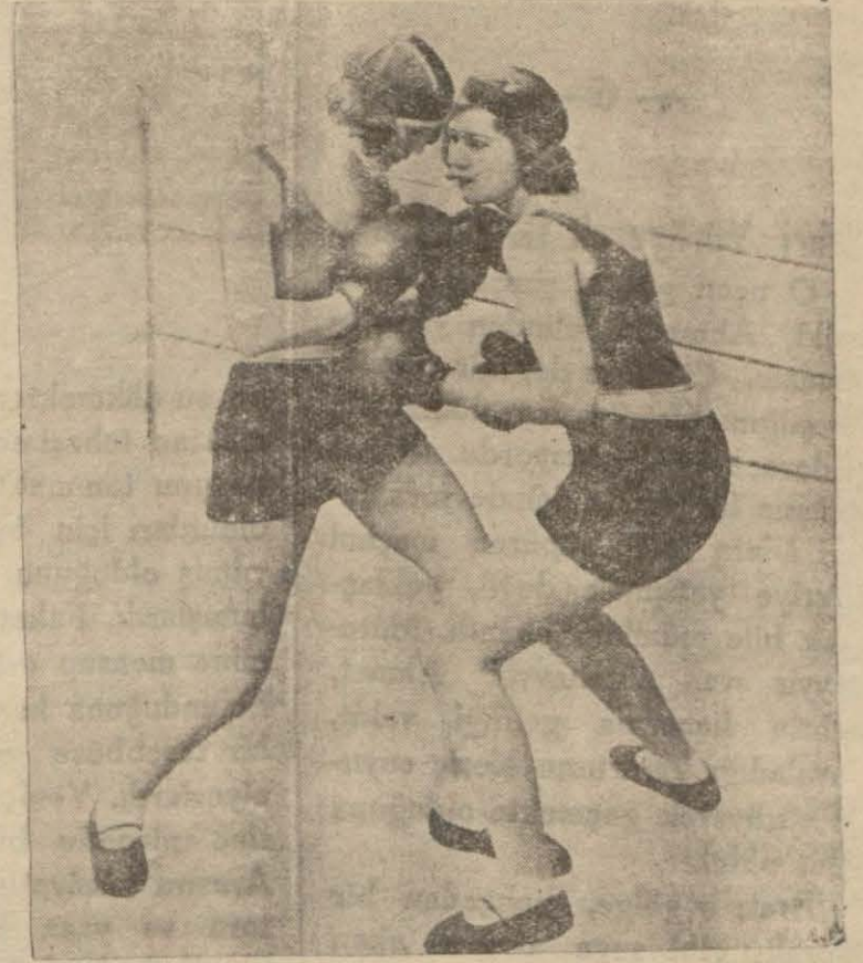
Yakında şehrimizde maç yapacak olan iki kadın boksör

Bu ikiplu vaziyette gol çıkarmıyorduk. Halk sabırsızlanıyordu. Gol isteriz! gol!... sedaları işitilirken Zeki topu ortaldan dan kaptı ve uzaktun takriben otuz metreden beraberlik golümüzü yaptı.